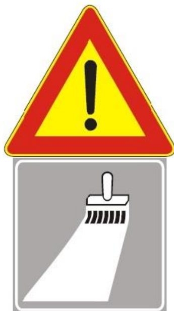
Figura Il 391 Art. 31