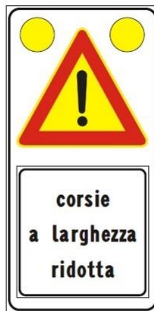
Figura Il 391c Art. 31